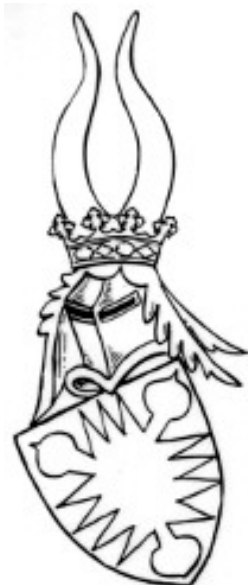
Rodový erb Bruna ze Schaumburku, biskupa olomouckého (podle Armoriálu Gerle)

Brunův erb nad kartuší byl převzat ze „Zrcadla“ Bartoloměje Paprockého. Skutečný erb hrabat ze Schaumburku však vypadal následovně.