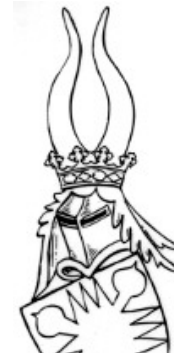
Rodový erb Bruna ze Schaumburku, biskupa olomouckého (podle Armoriálu Gerle)

Brunův erb nad kartuší byl převzat ze „Zrcadla“ Bartoloměje Paprockého. Skutečný erb hrabat ze Schaumburku však vypadal následovně.